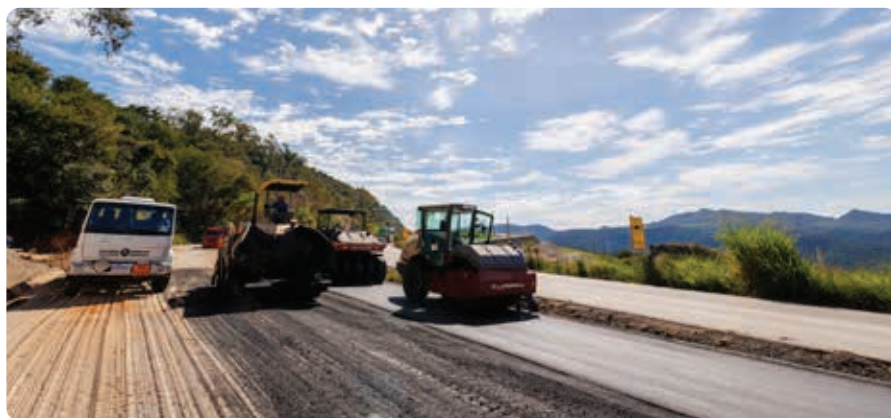
Pavimentação de trecho da Av. de Contorno

O trecho é classificado como Avenida de Contorno por ser uma via em perímetro urbano, que liga diferentes bairros da cidade, graças aos acessos nos trevos. A duplicação é estratégica para melhorar a mobilidade de quem quer circular entre as regiões e também de quem segue em direção a Belo Horizonte, ou sentido Raposos e Rio Acima.