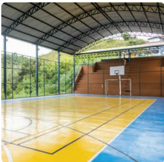
Quadra do Cruzeiro

externa da associação, que fica ao lado da quadra. Já em Honório Bicalho, a praça e a sede da associação comunitária também foram totalmente revitalizadas, recebendo novo paisagismo, instalação de playground e academia ao ar livre. O Governo Municipal investiu nas quatro obras mais de R$ 2,7 milhões.