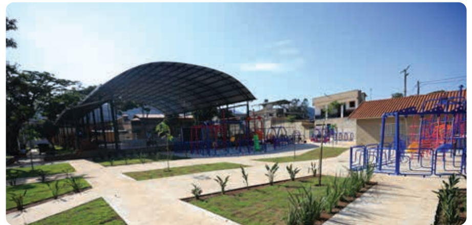
Quadra e praça em Honório Bicalho

A Prefeitura entregou a reforma das quadras dos bairros Cariocas, Cruzeiro, Galo e Honório Bicalho. Os locais passaram a contar com novo piso, alambrado, recuperação da estrutura metálica, pintura, novas demarcações, troca da fiação elétrica e instalação de refletores de led, reforma do vestiário. No Galo, também foi feita a pintura