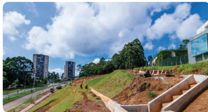
Serviços de terraplanagem e drenagem em Alphaville

Vias, espaços e unidades públicas passam por reconstrução, manutenção, recomposição e revitalização de estruturas físicas.