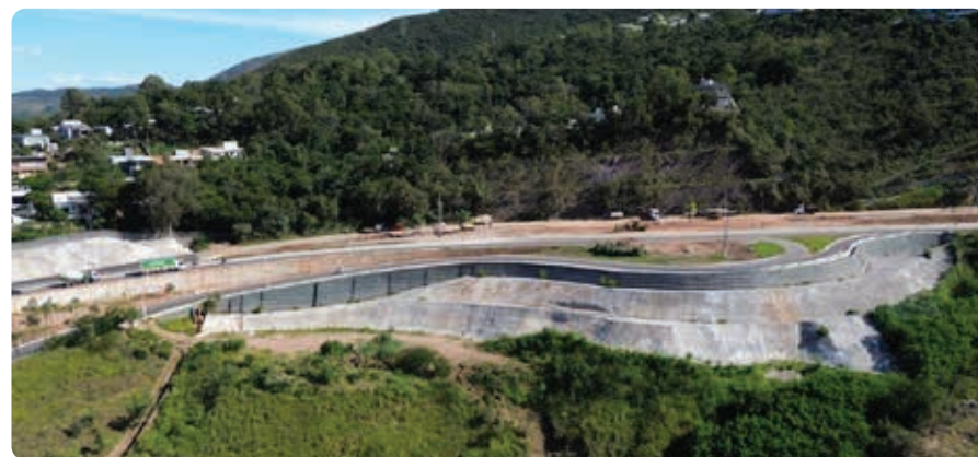
Solo grampeado em concreto projetado