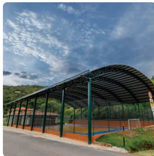
Quadra do Galo