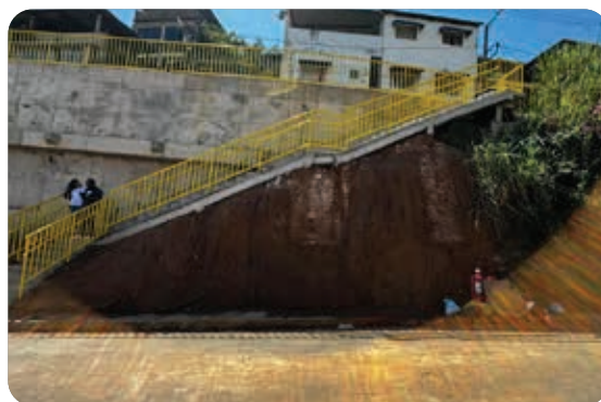
Obra entregue na rua Esmeralda

Na rua Esmeraldas, uma grande obra de terraplanagem, contenção, drenagem, pavimentação, meio-fio, sarjeta, passeio, corrimão e plantio de grama foi finalizada e entregue à população.